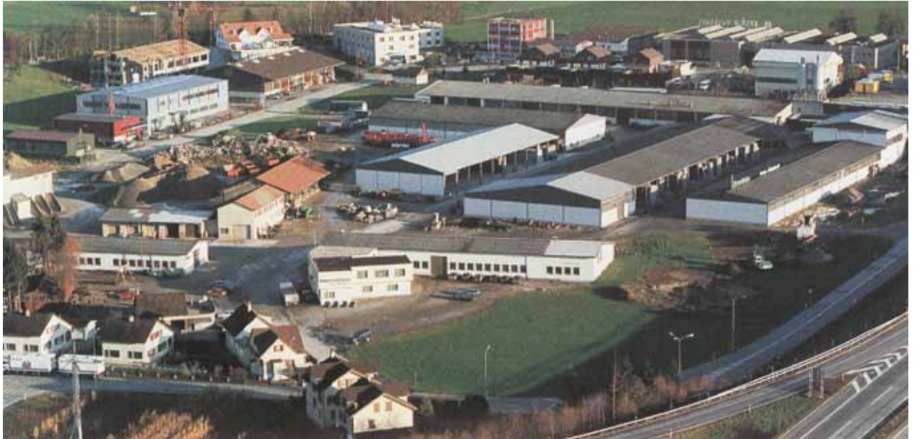
Firmensitz der Bürersteine AG in Oberbüren